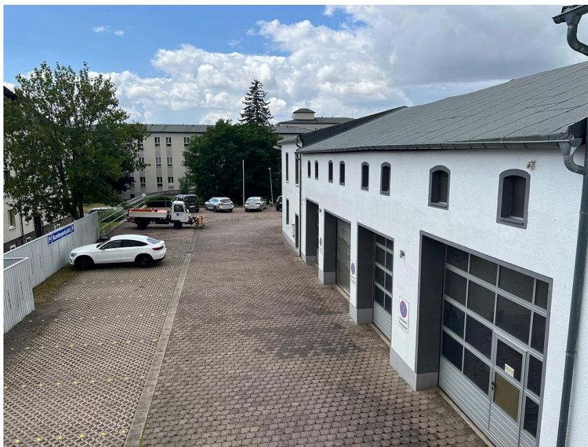
Sektionaltore und PKW Stellplätze